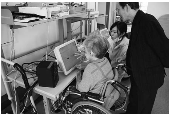
Obr. 7. Výuka hry na Cymis