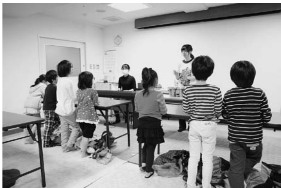
Obr. 12. Děti s ADHD

obecně velmi zdvořilý a plný úcty. Forma stravování tomu dodala punc. Byl jsem pozván na oběd. Dalo se předpokládat, že pro návštěvu z „Čeko“ se uvaří „lepší/slavnostnější“ oběd. Tedy v kontextu českých zkušeností. Ale jak jsem se dozvěděl od muzikoterapeutek, obdobné obědy jsou standard ( obr. 9 ).