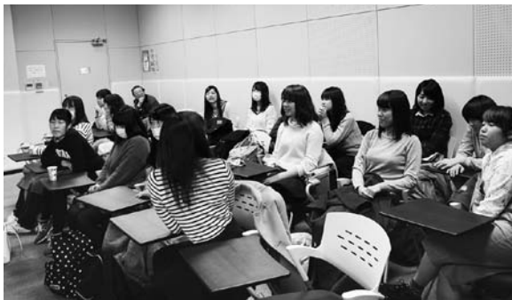
Obr. 5. Studentky konzultují