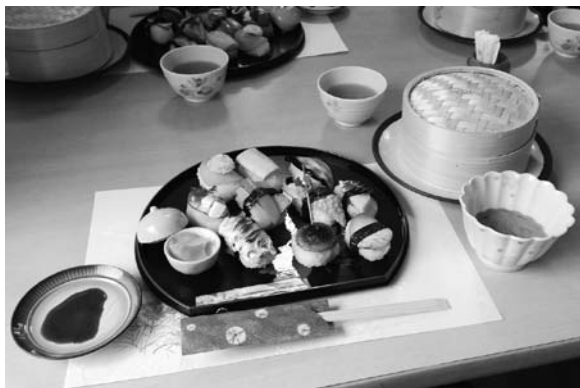
Obr. 9. Školní oběd