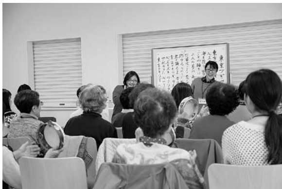
Obr. 10. Studentky se seniory