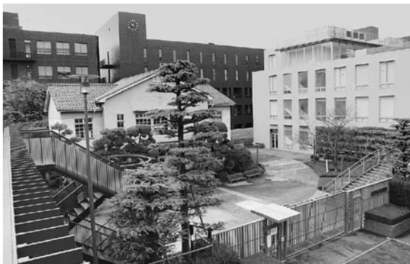
Obr. 1. Univerzitní kampus MWU s tradičními zahradami

Struktura univerzity je podobná té, kterou známe. Členění na úrovni jednotlivých kateder je odlišné oproti našim zvykostem. V čele stojí tzv. Full Professor, pod ním Associate Professor, dále Lecturer-Assistant Professor a Assistant Research Associate. A těmito pozicemi se i prezentují. Akademické tituly nepoužívají. Převedeme-li toto označení do našeho systému, tak se zjednodušeně vyučující s titulem Ph.D. a vyšším oslovuje profesor a s titulem Mgr. jako asistent profesora. Převzít tento systém by jistě uvítal náš nejvyšší státní reprezentant, kterému by logicky ubylo práce, neboť by nemusel jmenovat profesory s ohledem na to, že by jinak každý Ph.D. (a vyšší) musel projít stiskem jeho pravice, což by bylo extrém-