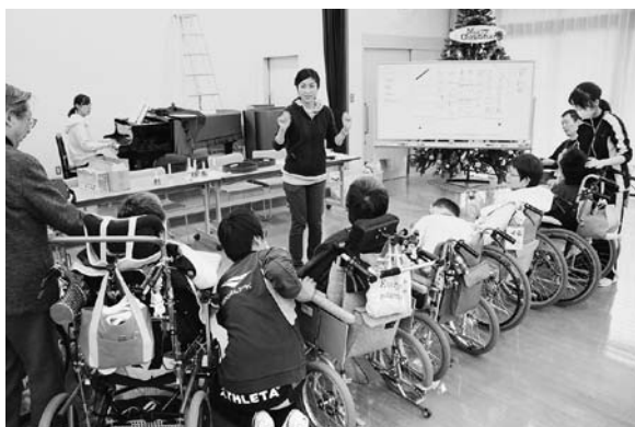
Obr. 11. Setkání s lidmi postiženými mozkovou obrnou

la (vedla svůj prst vedle jejího). Všiml jsem si, že klientka má potíže s pohyby na levé straně těla, které jí znemožňovaly dostatečný přesah pohybu z pravé na levou stranu. Popsal jsem toto praktikující muzikoterapeutce s tím, že kdyby došlo k posunutí dotykového monitoru více k pravé straně, kde měla klientka dostatečný pohybový rozsah, jednodušeji by se jí hrálo. Resp. by měla zvládat sama vrátet ruku na levý kraj monitoru. Po změně pozice klientka hrála sama a bez pomoci, což velmi ocenili. Následně probíhala diskuse nad možností vzdělávání v oboru speciální pedagogika, kterému se nevěnují v dostatečné míře.