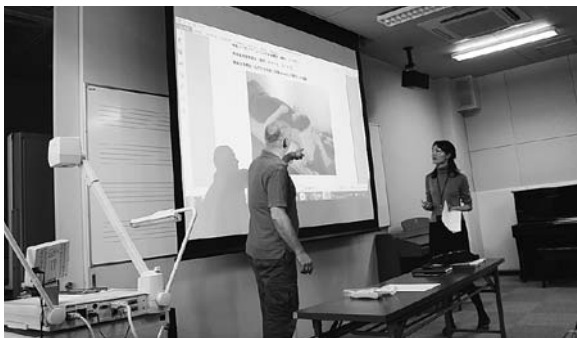
Obr. 4. Přednáška